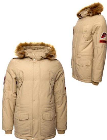
Куртка зимняя утеплённая бежевая с капюшоном и отделкой к капюшону из искусственного меха коричневого цвета