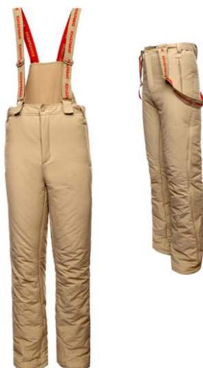
Брюки утеплённые (тактические) бежевого цвета