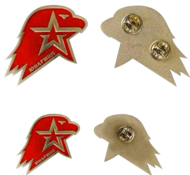
Большая (кокарда) и малая (значок) эмблема ВВпод «ЮНАРМИЯ»