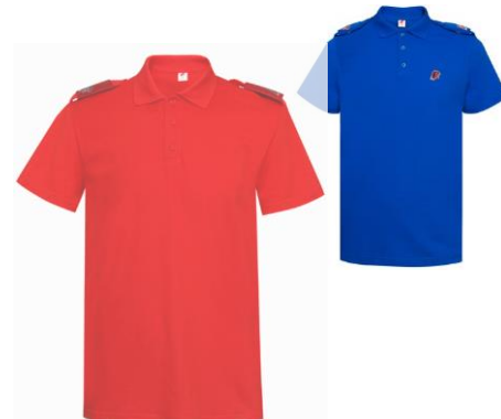
Рубашка поло красного (синего) цвета