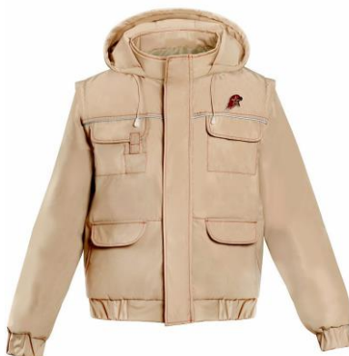
Куртка утепленная (демисезонная) бежевого цвета