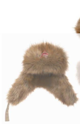
Шапка-ушанка бежевая с искусственным мехом коричневого цвета