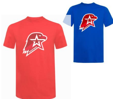
Футболка красного (синего) цвета