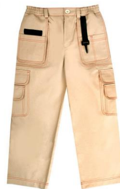
Брюки (тактические) бежевого цвета