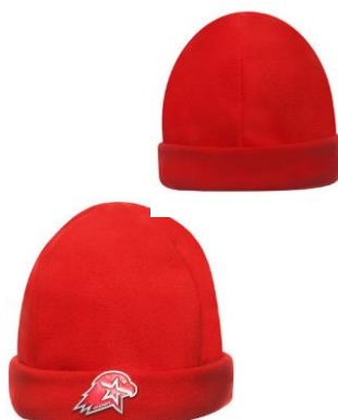
Шапка флисовая вязаная красного цвета