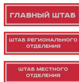
Нарукавный знак, устанавливающий принадлежность к структуре