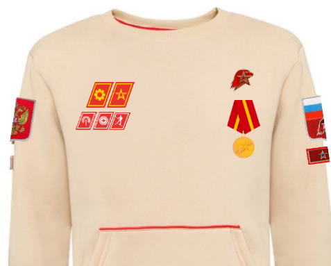
Размещение знаков различия, знаков отличия и иных геральдических знаков на толстовке бежевого цвета