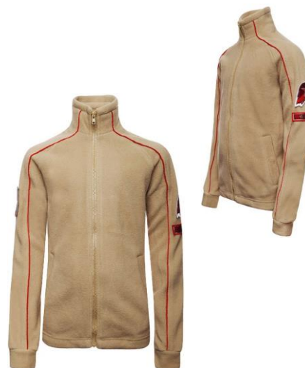
Жакет флисовый бежевого цвета