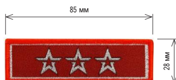
Нарукавный знак, определяющий принадлежность к ВВпод «ЮНАРМИЯ»