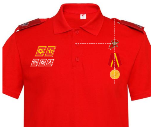
Размещение знаков различия, знаков отличия и иных геральдических знаков на рубашке поло красного (синего) цвета