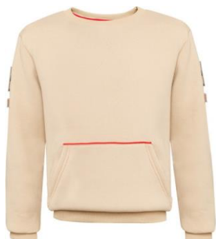
Толстовка бежевого цвета