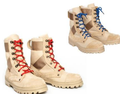
Ботинки с высокими берцами утеплённые бежевого цвета со шнурками красного (синего, бежевого) цвета