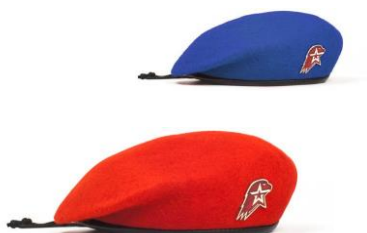
Берет шерстяной красного (синего) цвета, допускается другой цвет берета, в соответствии с воинскими традициями юнармейского отряда