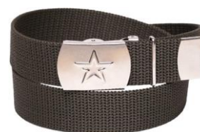
Кроссовки со шнурками красного (синего, бежевого) цвета