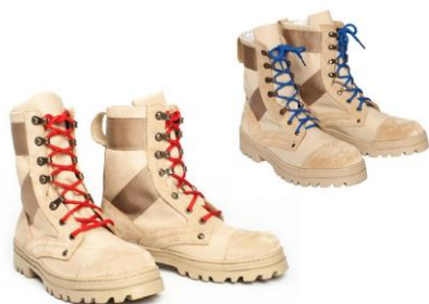
Ботинки с высокими берцами бежевого цвета со шнурками