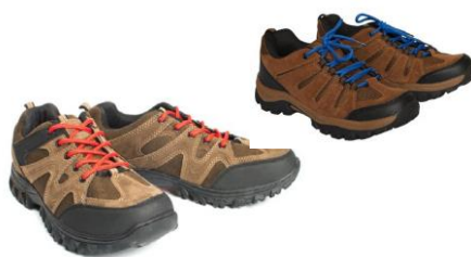
красного (синего, бежевого) цвета